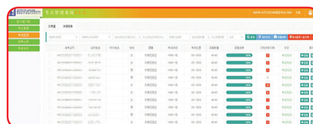
Back-end system Test Point Semarang.

Medan dan Kalimantan Barat. Karena banyaknya jumlah peserta ujian, pengaturan dan organisasi yang cermat maka hal tersebut telah menjamin ujian HSK berlangsung dengan lancar. Pada 12 Desember 2020 ada sebanyak 1160 peserta yang ikut serta dalam ujian hari itu.