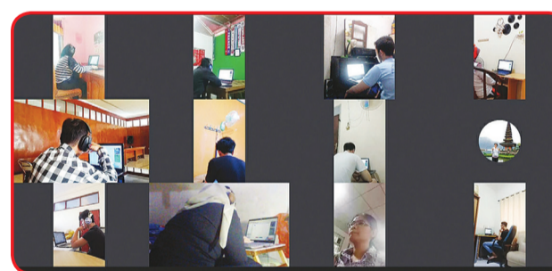
Gambar monitoring Ujian HSK Online Home Test Test Point Palembang.

tor Terpadu Pengajaran Bahasa Tionghoa Kemendikbud RI bersama BKPBM Jakarta melalui anggota panitia ujian HSK seluruh Indonesia yang terdiri dari 16 Test Point Ujian HSK sukses menyelenggarakan ujian HSK kepada 3796 orang peserta ujian. Ujian HSK Online Home Test tersebut berlangsung 23 Agustus, 17 Oktober dan 6 Desember 2020 lalu.