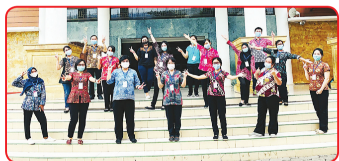
FOTO BERSAMA: Pimpinan dan guru pengawas Ujian HSK Test Point Bali berfoto bersama