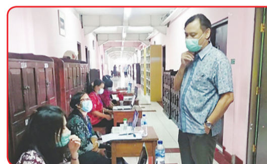
BALLI: Ketua Ujian HSK Test Point Bali dan Guru Pengawas.