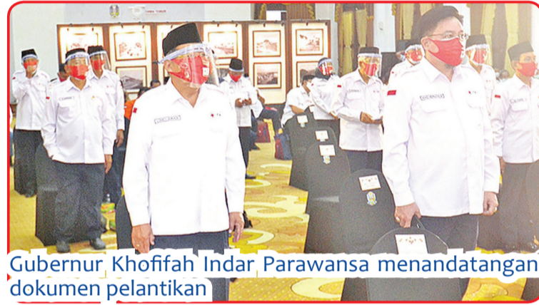
Gubernur Khofifah Indar Parawansa menandatangani dokumen pelantikan

cana, paling lambat enam jam setelah terjadi bencana melawan PMI sudah sampai lokasi. Itu adalah sebuah aksi cepat yang sangat baik dan patut dipuji.