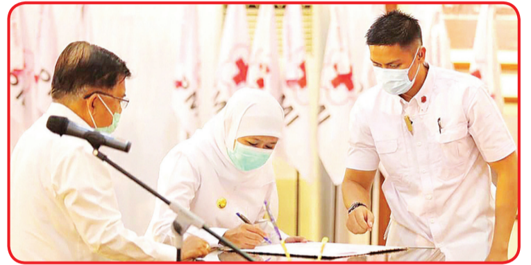
Suasana pelantikan dewan pengurus PMI Jatim.