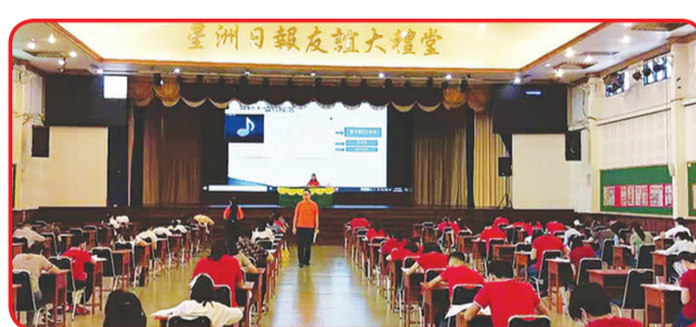
Suasana Ujian HSK Test Point Medan 6 Desember lalu.