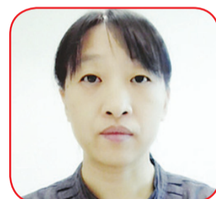
Situasi inspeksi Test Point.