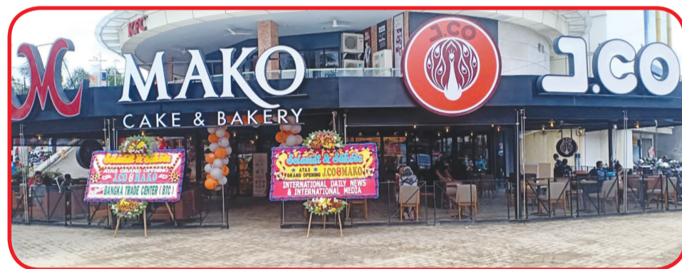
Store JCO-Mako Cake&Bakery

Jepang yang terkenal dengan kebersihan dan design minimalis namun tetap authentic. Hal ini pun diterapkan pada outlet MAKO Cake and Bakery yang di design dengan warna-warna terang dan sentuhan kayu alami untuk memberikan suasana warm, sehingga dapat memberikan kesan nyaman bagi setiap pelanggan yang berkunjung. Ada lebih dari 30 varian roti yang disajikan di MAKO Cake and Bakery yang berlokasi di Bangka Trade Center, salah satunya adalah Yakisoba Pan, roti lembut dengan isian mie goreng khas Jepang yang menggugah selera. Sebagai informasi tambahan, dalam memeriahkan Grand Opening JCO Bangka Trade Center, JCO memberikan paket promo khusus bagi para JCO Lovers. Dimana pada 18 - 30 Desember 2020, customer dapat menikmati pilihan paket 2 Beverages ukuran Due seharga Rp52.000, 3 Box Jpops mini donuts seharga Rp105.000. Promo tidak berlaku hari Sabtu, Minggu dan Hari Libur Nasional. S & K Berlaku. • bam/kris