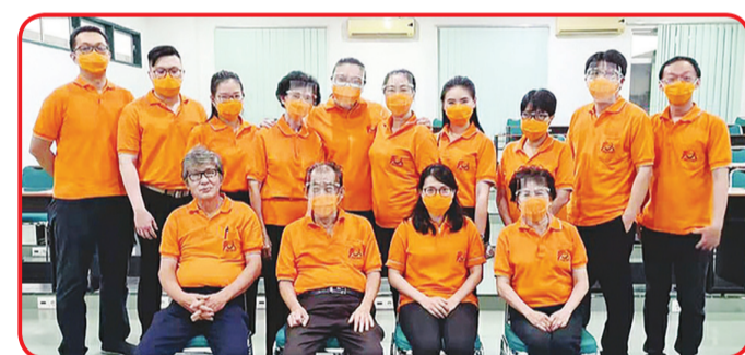
FOTO BERSAMA: Pimpinan dan guru pengawas Ujian HSK Test Point Medan berfoto bersama.