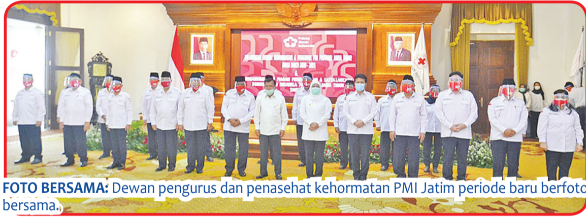
FOTO BERSAMA: Dewan pengurus dan penasehat kehormatan PMI Jatim periode baru berfoto bersama.