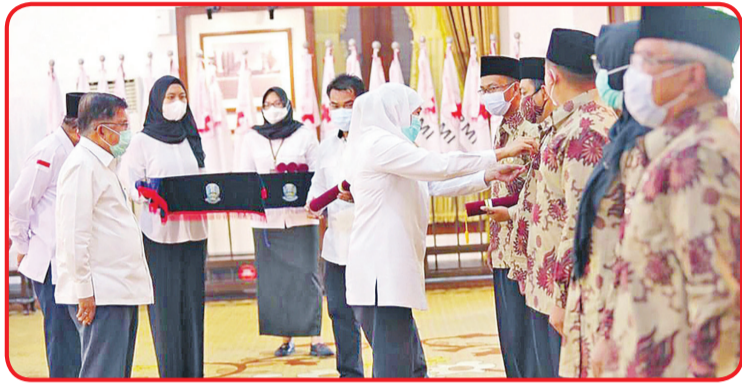
SEMATKAN PIN: Gubernur Jawa Timur Khofifah Indar Parawansa menyematkan pin kepada pendonor darah sukarela.

Dimana SOP bagi PMI kabupaten dan kota tempat ben-