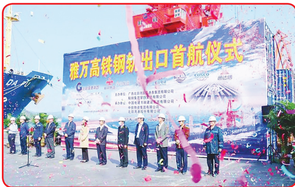
Sejumlah tokoh menghadiri upacara pengiriman tahap pertama rel baja sepanjang 50 meter untuk Kereta Cepat Jakarta-Bandung.

Departemen Proyek Kereta Cepat Jakarta Bandung telah menerapkan kebijakan