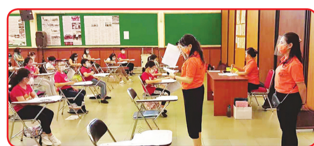
MEDAN: Ujian HSK Medan saat wabah corona.

Pimpinan 16 lokasi Test Point Ujian HSK seluruh Indonesia amat fokus pada ujian HSK Home Online Home Test ini. Mereka juga telah beberapa kali menyelenggarakan rapat pra tes dan pelatihan pengawas ujian. Sebelum penyelenggaraan ujian, mereka juga aktif mengorganisir dan mengatur para peserta ujian mengikuti simulasi ujian HSK. Sehingga peserta ujian terbiasa dengan pelaksanaan ujian. Sekaligus dapat menjawab pertanyaan tepat waktu. Bisa dikatakan demi kelancaran pelaksanaan ujian HSK Online Home Test, Panitia Ujian HSK Seluruh Indonesia (Koordinator Terpadu Pengajaran Bahasa Tionghoa Kemendikbud dan BKPBM Jakarta) serta 16