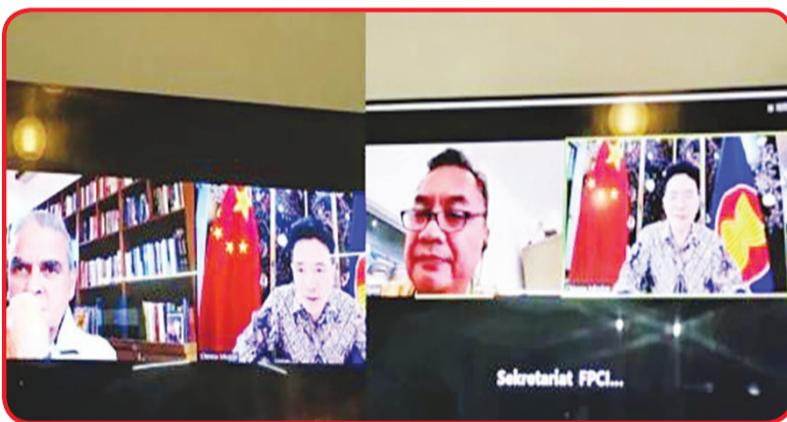
Suasana interaksi antara Dubes Deng Xijun bersama Dino Pati Djalal dan Kishore Mahbubani.

topik termasuk hubungan ASEAN, kerja sama regional Asia Timur serta situasi kawasan regional.