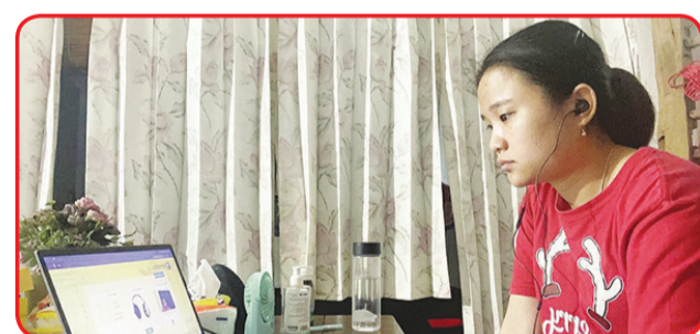
MALANG: Suasana Ujian HSK Online Home Test Test Point Malang.